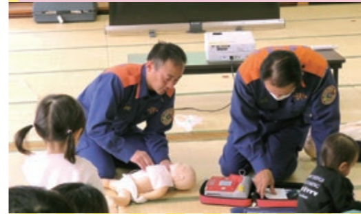
依頼会員対象講習会