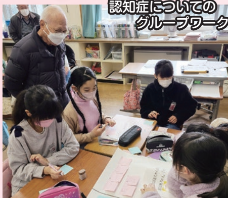
認知症についてのグループワーク