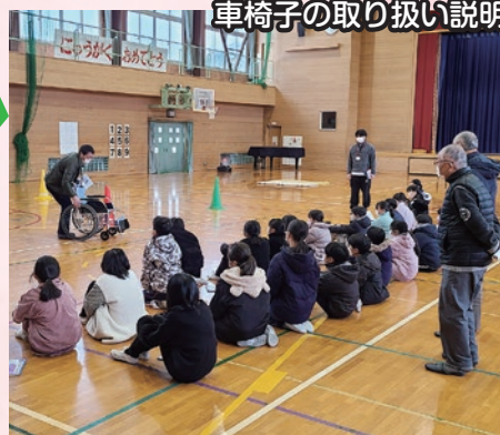
車椅子の取り扱い説明