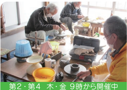
第2・第4 木・金 9時から開催中