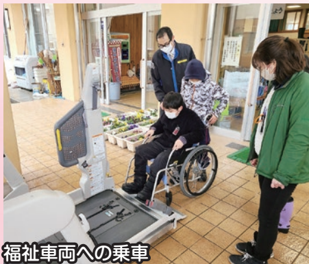
福祉車両への乗車