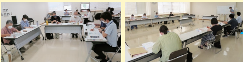
令和4年度 養成講座の様子

専門職(弁護士・司法書士・社会福祉士など)・親族以外で家庭裁判所から 選任される補助人・保佐人・成年後見人です。