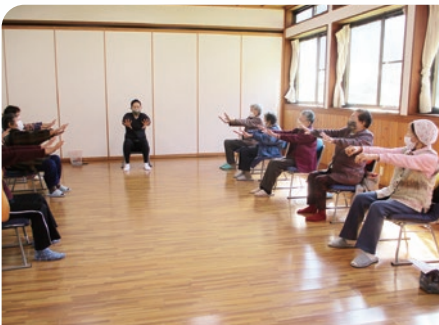
介護予防レクリエーション

令和5年度は、新たに消防署にもご協力いただくことになりました。ぜひともお役立てください。他の総合福祉センターでも予定しておりますので、ぜひご利用ください！