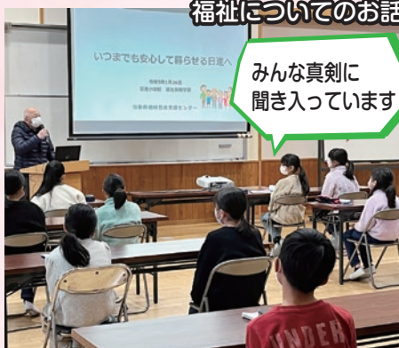
福祉についてのお話