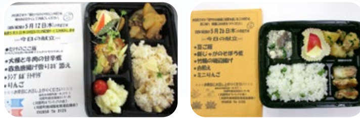
4月は、さくらご飯 や たけのこご飯、 5月は、豆ごはん をお届けしました。