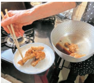
生活援助型のサポート例

鳥取市内在住で、65歳以上の高齢者(生活援助型)、小学校6年生までの子どもを持つ家庭(育児型)の困りごとを支援する組織です。サポートをして欲しい&行いたい人がそれぞれ会員となり地域で助け合う活動です。有償のボランティア活動ですので、料金が必要です。