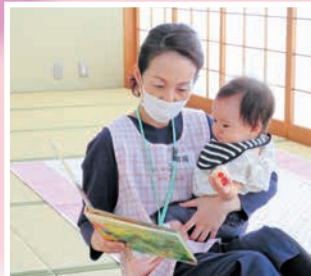
育児型のサポート例