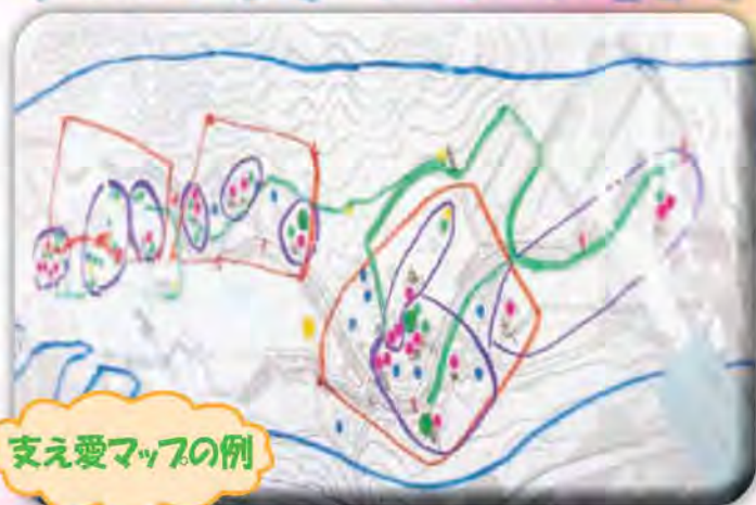
支え愛マップの例