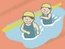
毎週火曜日 リハビリ教室の様子