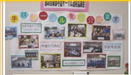
鳥取県東部手話サークル連絡協議会