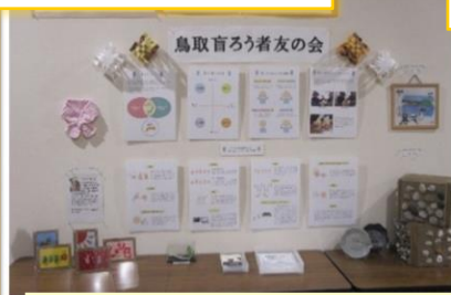
鳥取盲ろう者友の会

普段のサポート支援や交流会の様子、会員の方が作成された美術作品を展示されました。