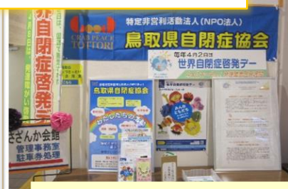
(特) 鳥取県自閉症協会