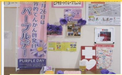
ピアサポートグループ フレンズ

パープルデー等の案内をされ、この展示をきっかけに新しい会員さんが入会されたそうです!