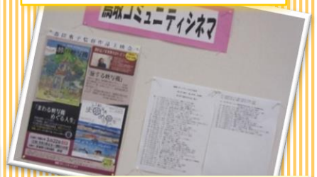
鳥取コミュニティシネマ

パープルデー等の案内をされ、この展示をきっかけに新しい会員さんが入会されたそうです!