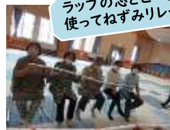
ラップの芯とビー玉を使ってねずみリレー