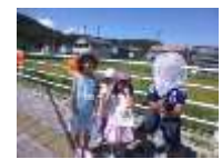
七夕交流会（8月）生き物の現地調査（8月）