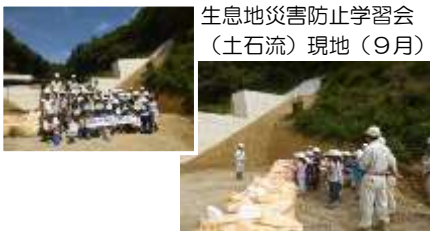
生息地災害防止学習会（土石流）現地（9月）