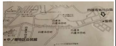
生息地の案内図です。ホタルの鑑賞時期は例年6月初旬。※ 近年、鳥獣類の出没等理由で夜間の観察会が開催出来ないのが残念です。