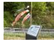
ホタル生息地（重点地域）（5月）