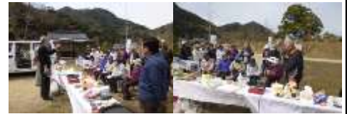
環境保全山野草学習会の状況（3月）