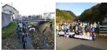
カワニナ放流会（11月）