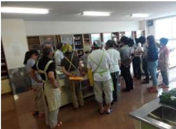
災害食にチャレンジ！毎月開催しています。災害コンロの起動も学びます。

災害食レスキューのノウハウを伝えます。まず自分が助かる術を学び、家族を助けます。栄養士、介護士さんを「ノウハウ」でサポートします。